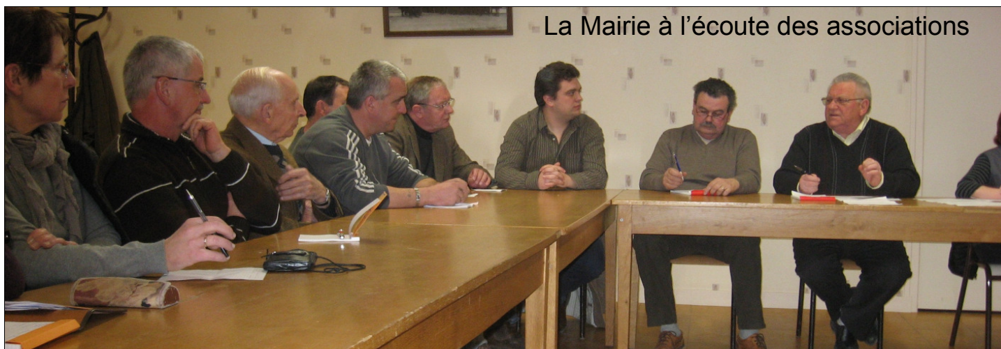
La Mairie à l'écoute des associations